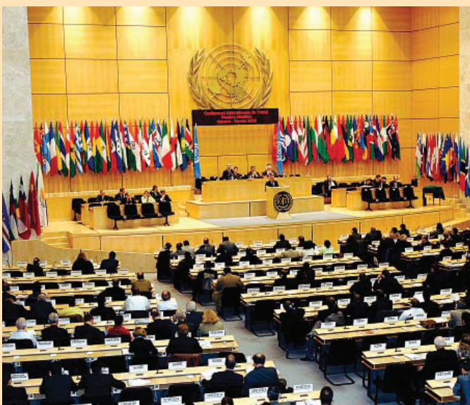
Міжнародна конференція праці

У системі ООН МОП має унікальну тристоронню структуру, де працівники та роботодавці беруть участь у роботі її керівних органів поряд з урядами як рівні партнери. З розширенням трудової міграції МОП має зобов'язання і унікальну роль у розробленні принципів і керівних рекомендацій для урядів, соціальних партнерів та інших зацікавлених сторін щодо політики та покращення практики у досягненні гідної праці й соціальної справедливості задля справедливої глобалізації.